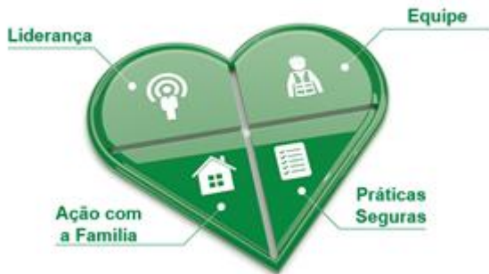
Fig. 3: Mandala do Site Seguro representando os 4 momentos do programa

conquistar cada uma das partes realizando esses momentos.