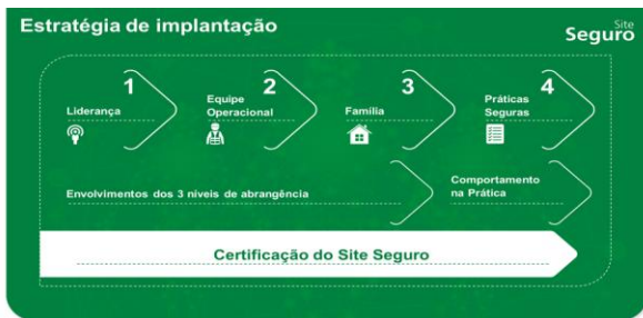
Fig. 1: Estratégia de implantação de Site Seguro dividida em 4 momentos

A seguir, encontra-se a explicação de cada um dos momentos do site seguro.