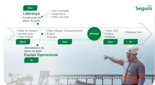
Fig. 2: Implantação dos Momentos Liderança e Equipe

É neste momento em que todos os empregados do site conhecem o programa na íntegra e começam a se envolver tanto na prática quanto no planejamento dos momentos Família e Prática Segura.