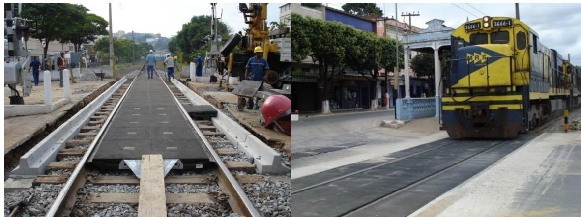
Piso de Borracha para Passagens de Nível - MRS